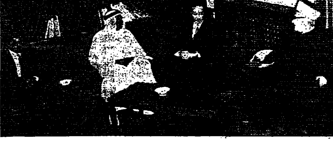
وفد رابطة العالم الاسلامي يستمع الى حديث دولة السيد بهجت التلهوني رئيس الوزراء (تصوير ١٠٢٠)